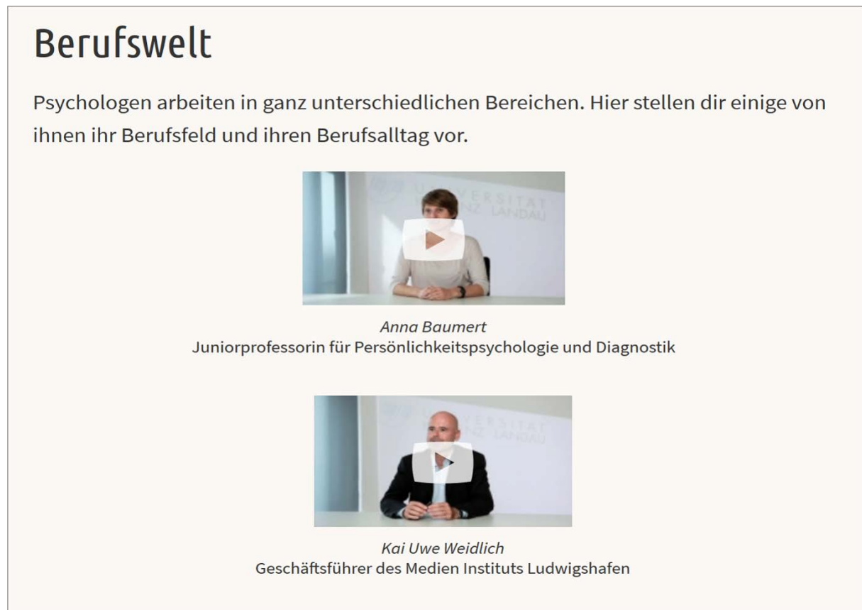
Abbildung 2: Videos zu Berufsperspektiven im OSA der Universität Koblenz-Landau (Studiengang Psychologie)

Erfahrungsberichte in schriftlicher Form möglich ist. Ein Nachteil liegt darin, dass im Fall von Videoaufnahmen